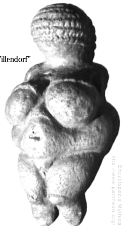
Die „Venus von Willendorf“